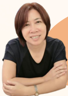
會芳苑 人本教育基金會 台中辦公室主任