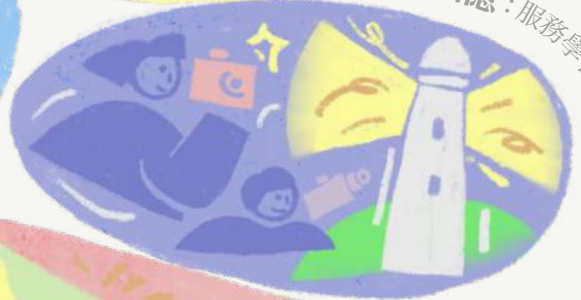
定格馬祖的回憶：服務學習V落客專訪