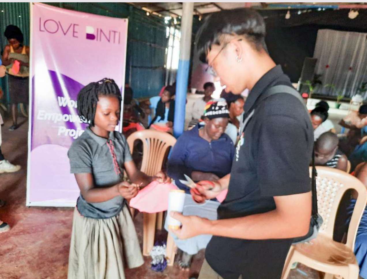
◀ 烏干達團隊夥伴教導當地民眾縫製布衛生棉