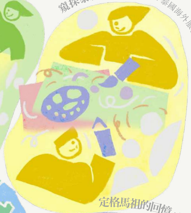
窺探泰緬邊境的面紗：泰國海外服務學習團隊（泰2班）專訪