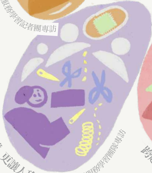
因為分離，更讓人珍惜：烏干達海外服務學習團隊專訪