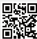
服務學習中心粉絲專頁